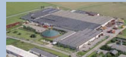
Nørre Alslev, Dinamarca