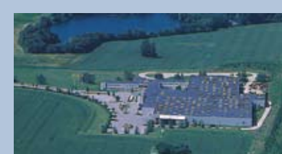
Heje Tåstrup, Dinamarca