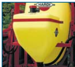
Depósito de enjuagado