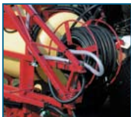
Enrollador de manguera