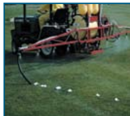
Marcador de espuma