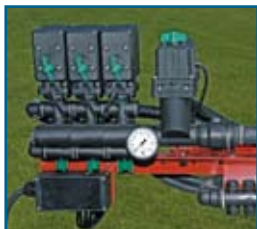
Regulador EVC espuma